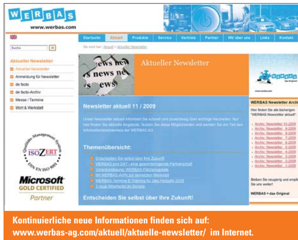
Kontinuierliche neue Informationen finden sich auf: www.werbas-ag.com/aktuell/aktuelle-newsletter/ im Internet.

So werden jetzt verschiedene Schulungsvideos zu den Grundfunktionen von WERBAS auf der Homepage zum Download angeboten. „Es ist unser Ziel, den Kunden rund um die Uhr schnelle Hilfe anzubieten, wenn gewisse Bedienvorgänge im Kopf nicht mehr parat sind.“ In einem ersten Step wurden jetzt fünf verschiedene Videos eingestellt. Mit diesen kann man nicht nur sein Wissen bezüglich der Aufgabschnellanlage auffrischen, sondern zudem erfahren, wie Aufträge bearbeitet und reaktiviert werden können. Zudem wurde die Suche nach