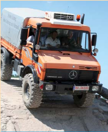
Unimog-Daten stehen jetzt auch in WERBAS parat.