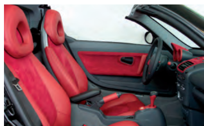
Hero Hesse ermöglicht ein individuelles Design der Fahrzeuge.

Schon seit Jahren arbeitet das Unternehmen dabei ausschließlich mit Fahrzeughändlern und Herstellern zusammen. Anfragen von Endkunden werden immer an die entsprechenden Partnerwerkstätten weitergegeben. Um noch mehr Autohäusern und Werkstätten die Möglichkeit zu bieten, sich durch die Aufwertung von Lager-, Neu- und Gebrauchtfahrzeugen eine neue Ertragsquelle zu erschließen, wurde der Hero-Hesse-Sitzkonfigurator entwickelt, mit dem nicht nur Sitze individuell zusammengestellt werden können, sondern über den auch die gesamte Bestellung abgewickelt werden kann. Teil des Systems ist eine umfassende Datenbank, in die bereits zahlreiche Fahrzeugmodelle von insgesamt 33 Her-