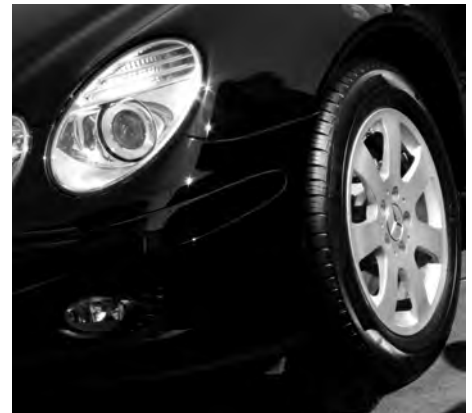
Kontinuierlich erweitert WERBAS die Einbindung von anderen Systemen.

Schnittstellen zu unterschiedlichen Informations- und Bestellsystemen zahlreicher Hersteller, Lieferanten und Organisationen geschaffen. Dazu gehört seit Kurzem auch die Verbindung von WERBAS zum Mercedes-Benz Ersatzteilkatalog EPC-net und der dadurch möglichen direkten