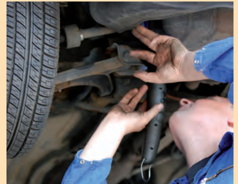
Auch Lösungen zur zeitwertgerechten Reparatur bietet WERBAS seinen Kunden.