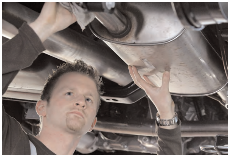
Direkt aus WERBAS heraus kann jetzt auf das Online-Bestelltool WebParts zugegriffen werden.

Unternehmens. Entscheidend sei dabei, dass die Software als Hilfsmittel einen Beitrag dazu leistet, dass das Tagesgeschäft schnell und unkompliziert erledigt werden kann. Aus der Position des neutralen Mittlers wurden so bereits über 100