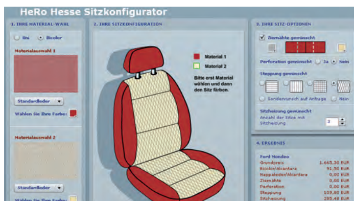
Schnell und übersichtlich lassen sich mit dem Sitzkonfigurator die eigenen Sitze gestalten.

stellern eingepflegt wurden und die kontinuierlich ausgebaut wird. Neben der Beratung der Kunden erfolgt in der Werkstatt nur der Aus- und Einbau der Sitze. Diese werden dann in Spezialbehältern zu Hero Hesse gesandt und dort aufbereitet.